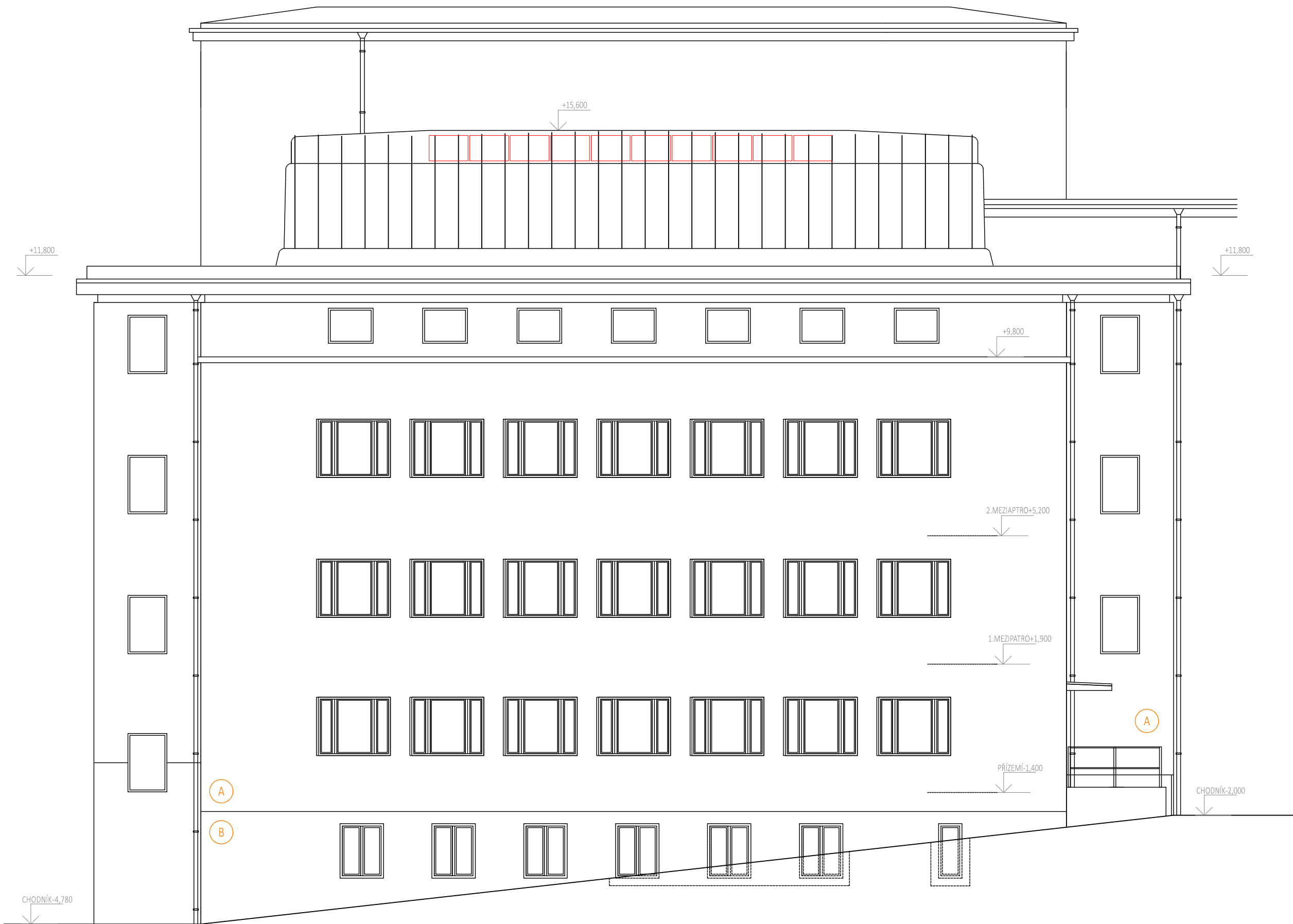
VÝCHODNÍ FASÁDA JIŽ BYLA ZATEPLENA V ROCE 2010, BUDE ZACHOVÁNA KOMPLETNĚ BEZ ÚPRAV.